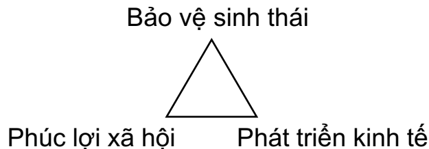
(Mô hình PTBV theo LHQ)

Liên Hợp Quốc đã xác định “Phát triển bền vững là sự phát triển đáp ứng những nhu cầu hiện tại mà không làm tổn hại đến khả năng của các thế hệ tương lai trong việc đáp ứng các nhu cầu của họ” (1987). Theo đó, phát triển bền vững là kết quả tổng hoà của ba mặt cơ bản: bền vững về mặt môi trường, bền vững về mặt kinh tế và bền vững về mặt xã hội. Sau đó 40 năm, các mục tiêu phát triển bền vững (17 SDGS) của Liên Hợp Quốc giai đoạn 2015-2030 vẫn xoay quanh ba mặt này và được đưa vào chính sách vĩ mô của nhiều quốc gia.